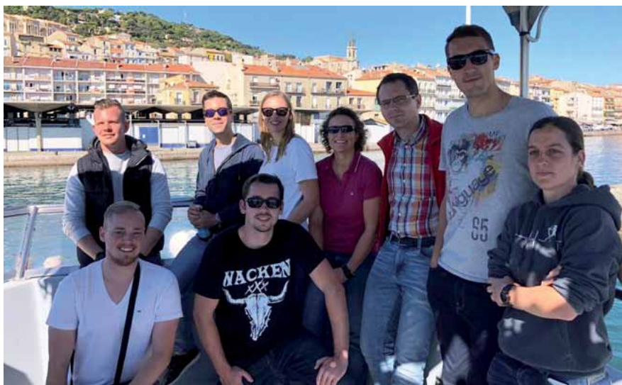
Unsere Teilnehmer/-innen aus Güstrow, Waldeck, Anklam, Neubrandenburg und Wismar